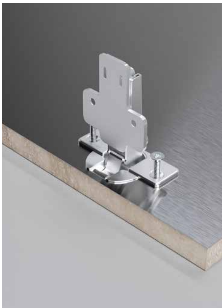
Sistema di fissaggio per cerniere