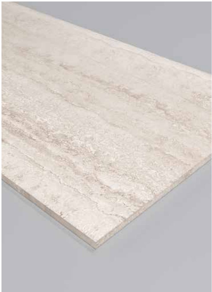
Bordo a tutto spessore