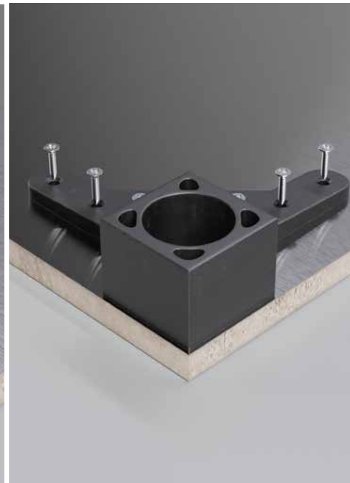
Sistema di fissaggio piani per tavoli