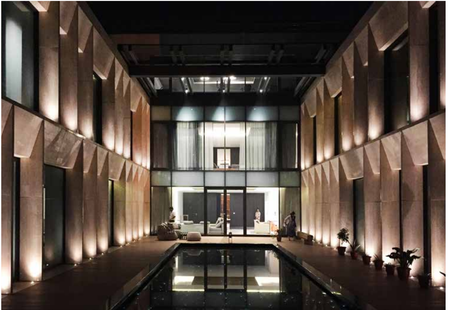
Elemento monolitico 1